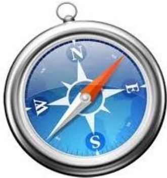
Figura N° 2. Logo de Safari