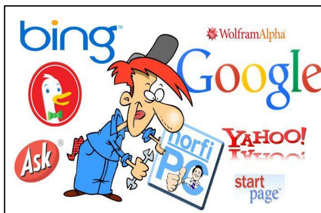
Figura N° 6. Buscadores web

Estos buscadores, o motores de búsqueda, no son más que aplicaciones informáticas que rastrean la Web catalogando, clasificando y organizando la información, para después ofrecérsela a los navegantes. Podrían definirse como grandes bases de datos indexadas de páginas Web. Internet cuenta con decenas de millones de páginas web con lo que parece difícil que de entre semejante cantidad de información podamos encontrar lo que buscamos. Pues bien, para encontrar