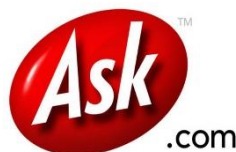
Figura N° 51. Logo