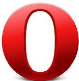
Figura N° 1. Logo de Opera