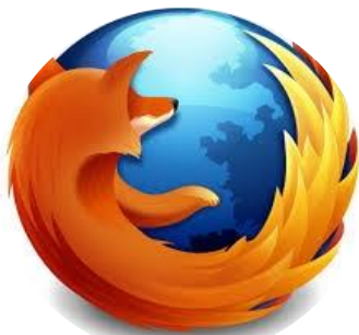
Figura N° 3. Logo de Mozilla Firefox