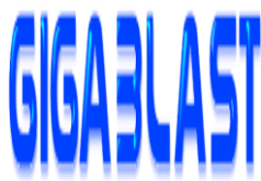
Figura N° 50. Logo

www.gigablast.com www.ask.com www.duckduckgo.com