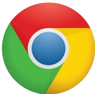
Figura N° 5. Logo Google Chrome