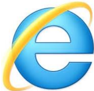
Figura N° 4. Logo de Internet Explorer